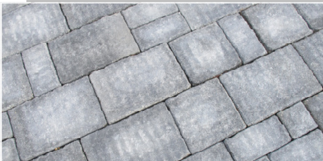
Vitale Alt Farbe: naturgrau-anthrazit nuanciert