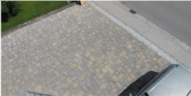
Vitale Alt Farbe: sand-anthrazit nuanciert