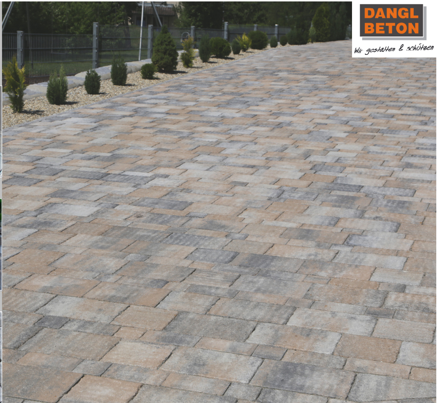
Vitale Alt Farbe: muschelkalk

Alle Produkte werden aus natürlichen Materialien hergestellt, Farbabweichungen sind möglich. Druckfarben können von den realen Farben abweichen.